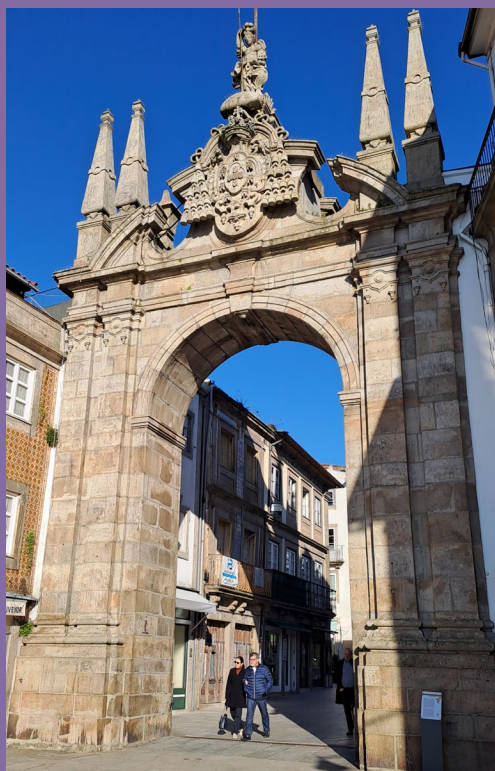
Braga 41 km